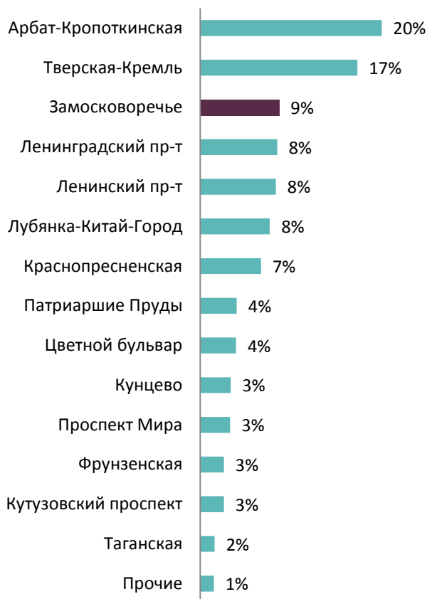
Граф.1. Территориальное распределение предложения квартир