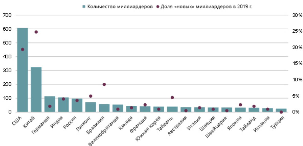
Граф.2. Распределение количества миллиардеров по странам происхождения

Быстрый экономический рост Китая, увеличивающийся средний класс и курс развития страны в целом – все это способствует нарастанию волны появления новых миллиардеров. Согласно данным Forbes, по количеству новичков, которые появились в рейтинге в 2019 г., четверть из них родом из Китая (это больше, чем в любой другой стране мира). Тем не менее США по количеству миллиардеров в целом по-прежнему лидируют с большим отрывом - 28% всех ультра богатых людей в мире. Далее идет Китай, где миллиардеров почти в 2 раза меньше, чем США в 2019 г., - 15%.